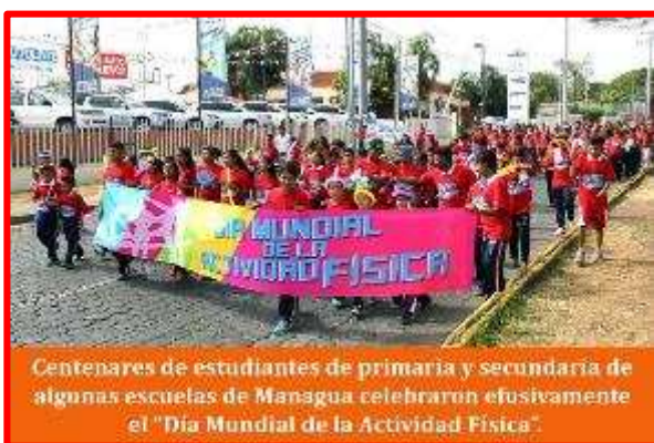
Centenares de estudiantes de primaria y secundaria de algunas escuelas de Managua celebraron efusivamente el "Día Mundial de la Actividad Física".

El miércoles 5 de Abril la Dirección de Educación Física del Instituto Nicaragüense de Deportes