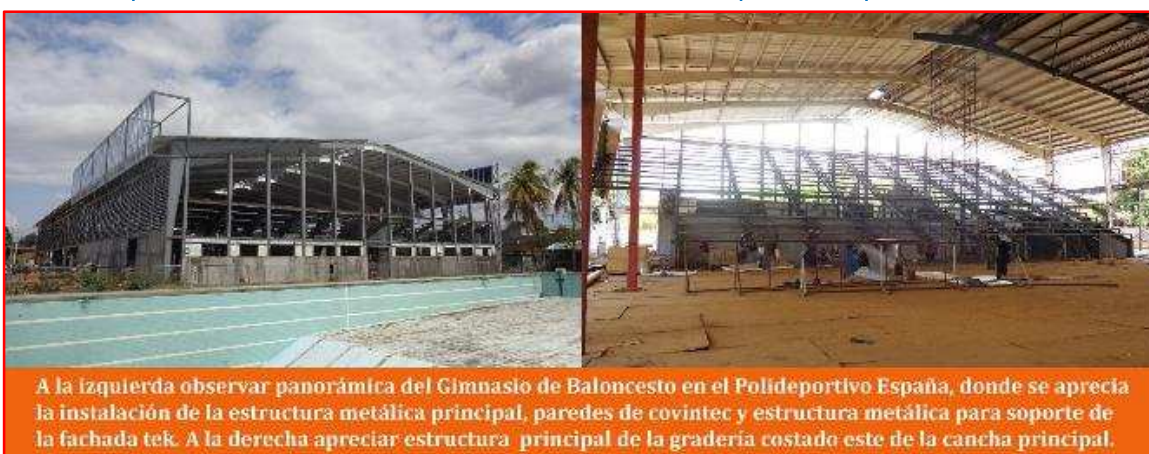
A la izquierda observar panorámica del Gimnasio de Baloncesto en el Polideportivo España, donde se aprecia la instalación de la estructura metálica principal, paredes de covintec y estructura metálica para soporte de la fachada tek. A la derecha apreciar estructura principal de la gradería costado este de la cancha principal.

Obra: Ampliación del Gimnasio de Baloncesto en el Polideportivo España.