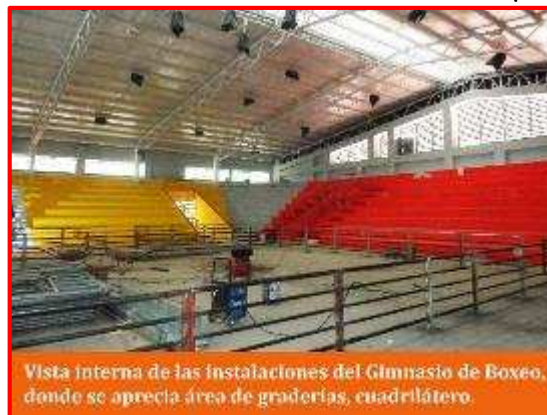
Vista interna de las instalaciones del Gimnasio de Boxeo, donde se aprecia área de graderías, cuadrilátero.

El 21 de abril del 2017, se realizó recepción de las obras, quedando pendiente concluir acabados en las puertas de madera en las áreas de servicios sanitarios, remates de pintura en general, acabados en rampa de acceso, mantenimiento de la grama, limpieza final.