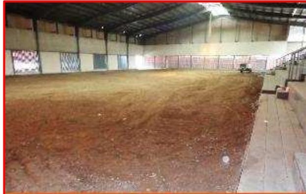
Vista interna del Gimnasio de Combate costado noroeste, donde se observa la demolición de losa de concreto y movimiento de tierra.

Está siendo ejecutado por la empresa Sociedad Wilson Construcciones Sociedad Anónima