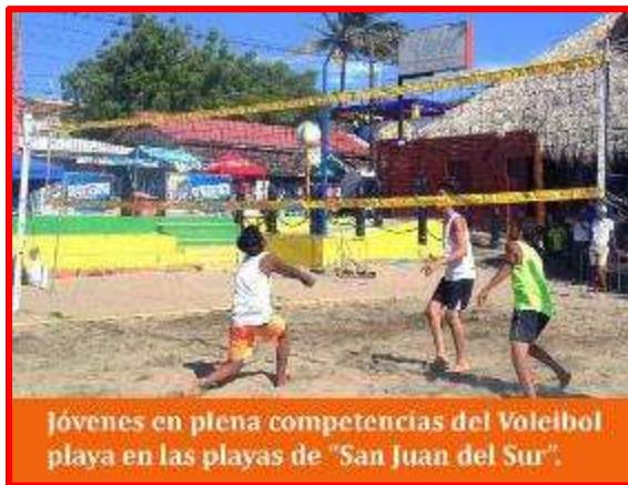
Jóvenes en plena competencias del Voleibol playa en las playas de "San Juan del Sur".

Posteriormente la fiesta veraniega se trasladó a los diferentes balnearios del país en donde se realizaron juegos de Fútbol Playa y Voleibol de Playa, entre ellos: La Boquita y Huehueté (Carazo), el Maniadero (Boaco), Corinto y Paso Caballo (Chinandega), Centro Turístico de Granada, PoneLOYA y Las Peñitas (Leon), Pochomil, Villa El Carmen y Xiloá (Managua), Laguna de Apoyo y Nandasmo (Masaya), San Juan del Sur y La Virgen (Rivas), San Miguelito y El Morrito (Río San Juan) y Bluefields (RAAS). La actividad logró reunir por el Fútbol Playa: féminas (527) y masculinos (3, 264) para un total de 3,791 y en el Voleibol de Playa, féminas (574) y masculinos (589) para un total de 1,163 participantes, lo que significó un total de: féminas (1,101) y masculinos (3,853) para el total general de 4, 954 participantes en el Plan