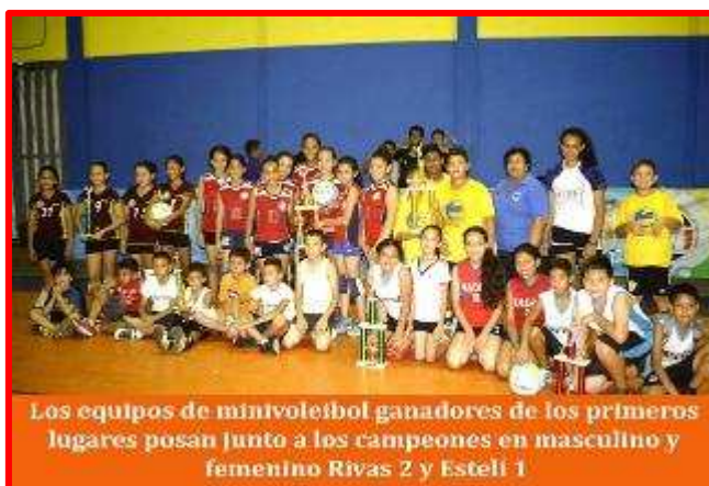
Los equipos de minivoleibol ganadores de los primeros lugares posan junto a los campeones en masculino y femenino Rivas 2 y Estelí 1

En el desarrollo de las competencias, los conjuntos de Rivas 2 y Estelí 1 lograron imponerse al resto de los equipos afianzándose en los principales puestos en las ramas masculina y femenina (se reunió a 20 equipos en total). Fueron diez escuadras entre los varones las que, pero fueron los integrantes de Rivas 2 los que se consagraron, derrotando en la final a Madriz 2-0 (21-10 y 25-12). Estelí 1 se quedó con la tercera plaza luego de derrotar 2-0 (21-14 y 21-16) a Rivas 3. Mientras entre las mujeres la gloria fue para Estelí 1 que alcanzó el título al vencer en la final a Madriz 2-0 (21-14 y 21-16), también compitieron 10 equipos entre las mujeres y en donde las jugadoras de Managua 1 ocuparon el tercer lugar, al vencer 2-0 (21-12 y 21-16) a Estelí 2 (los que quedaron en tres grupos, dos de ellos conformado por tres y uno con cuatro equipos. Avanzaron a semifinal los líderes de cada bloque y el mejor segundo lugar. En la justa deportiva asistieron representantes de los departamentos de Managua, Madriz, Chontales, Granada, Jinotega y Rivas.