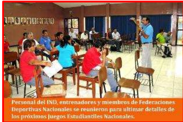
Personal del IND, entrenadores y miembros de Federaciones Deportivas Nacionales se reunieron para ultimar detalles de los próximos Juegos Estudiantiles Nacionales.

En la contienda deportiva se espera la asistencia de alrededor de unos 600 atletas escolares que competirán en los deportes de: Ajedrez, Atletismo, Gimnasia, Tenis de Mesa, Natación, Fútbol, Mini Voleibol y Mini Baloncesto, todos ellos en ambas ramas masculino y femenino.