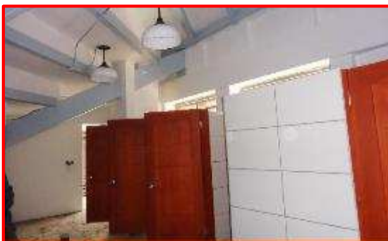
Vista interna de los servicios sanitarios de damas, ubicado debajo del área de graderías. Observar la ejecución de las actividades de pisos, azulejos en paredes, puertas, iluminación y pintura.

Obra: Reemplazo de Fachadas, Techos y Camerinos en el Gimnasio Alexis Arguello