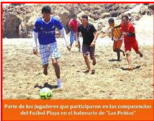
Parte de los jugadores que participaron en las competencias del Fútbol Playa en el balneario de "Las Peñas".