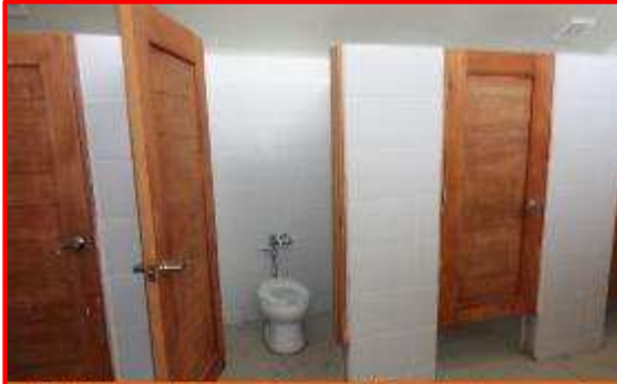
Vista interna de los servicios sanitarios, donde se aprecia la ejecución de las actividades de enchape de azulejos, inodoros, puertas de madera.

(WILCONSA); por un monto inicial de C$ 13, 121,418.75. La obra se inició el 22 de diciembre 2016, con un plazo de ejecución de 140 días calendario, teniendo previsto la finalización el 10 de mayo del 2017.